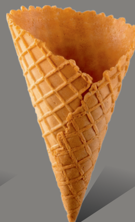
Wafel z rantem kopertowym Kod: 150/35 150 x 81 mm