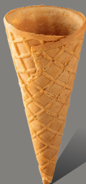
Wafel z rantem prostym Kod: 120 120 x 51 mm