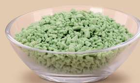
Herbatnik o smaku pistacjowym