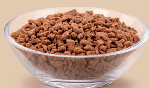
Crumble o smaku kakao