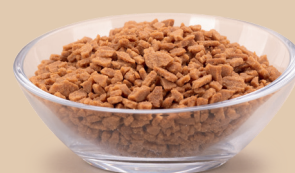
Crumble o smaku tiramisu

Posypki o średnicy 2-6 mm, które znajdują szerokie zastosowanie w produkcji przemysłowej i rzemieślniczej. Do zastosowania jako posypka i insert do środka gotowego produktu.