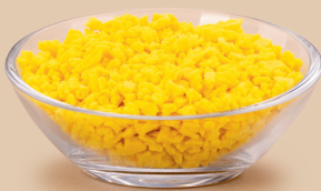
Herbatnik o smaku cytrynowym