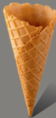
Wafel z rantem kopertowym Kod: 130/27 130 x 56 mm