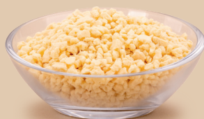
Herbatnik o smaku waniliowym