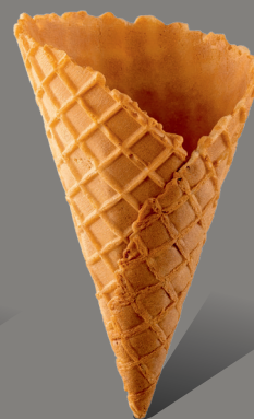
Wafel z rantem kopertowym Kod: 130/35 130 x 71 mm