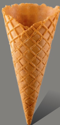
Wafel z rantem kopertowym Kod: 140/27 140 x 64 mm