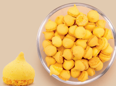
O smaku cytrynowym: makaronik cytrynowo-migdałowy