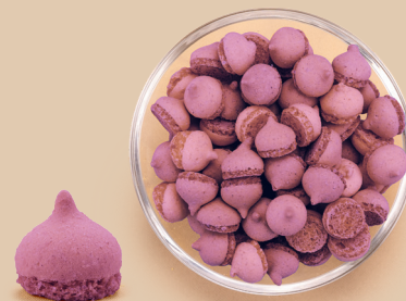
O smaku jagodowym: makaronik jagodowo-migdałowy

Mini półokrągłe kawałki o średnicy 10-12 mm o lekkiej teksturze. Utrzymują twardą i chrupiącą strukturę zarówno w środku lodów jak i na ich powierzchni. Możliwość wyprodukowania wielu różnych smaków w zależności od potrzeb klienta.