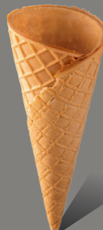
Wafel z rantem prostym Kod: 160 160 x 65 mm

Na życzenie klienta możliwość wyprodukowania wafli o wymiarach od 100 - 160 mm wysokości i o dwóch różnych kątach: 23, 27, kąt: 35, 100 - 150 mm (z prostym rantem jak i w kopertę)