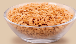
Wafel kruszony o smaku wanilia