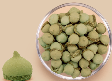
O smaku pistacjowym: makaronik pistacjowo-migdałowy