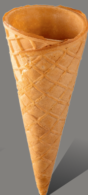
Wafel z rantem prostym Kod: 130 130 x 54 mm