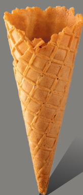
Wafel z rantem kopertowym Kod: 130/23 130 x 52 mm

Waniliowe rożki waflowe w kształcie stożka, w wersjach z prostym rantem oraz w kopertę.