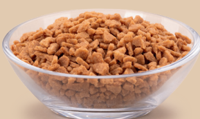
Crumble o smaku orzech laskowy