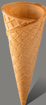
Wafel z rantem prostym Kod: 140 140 x 58 mm