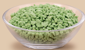
Herbatnik o smaku miętowym