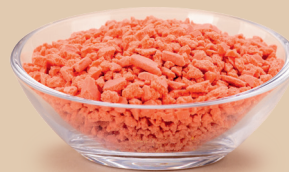
Herbatnik o smaku truskawkowym