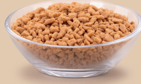
Crumble o smaku solony karmel