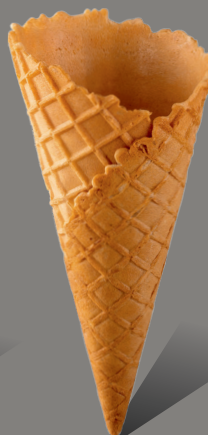
Wafel z rantem kopertowym Kod: 150/27 150 x 68 mm