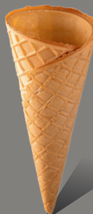
Wafel z rantem prostym Kod: 150 150 x 60 mm