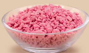
Herbatnik o smaku jagodowym