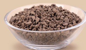
Herbatnik o smaku brownie