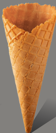
Wafel z rantem kopertowym Kod: 150/23 150 x 58 mm